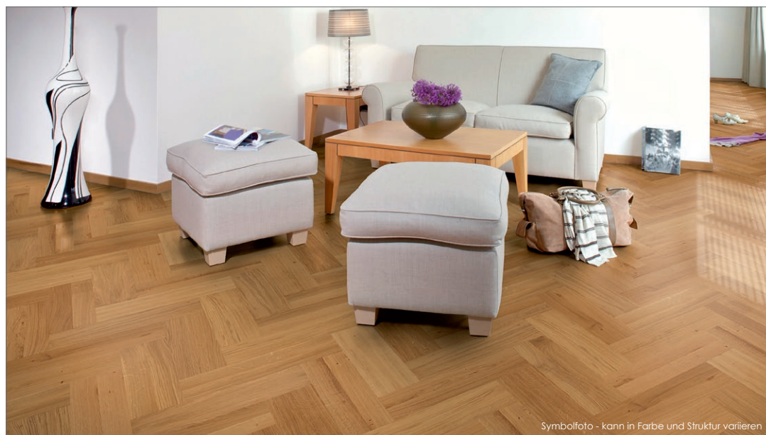
Symbolfoto - kann in Farbe und Struktur variieren