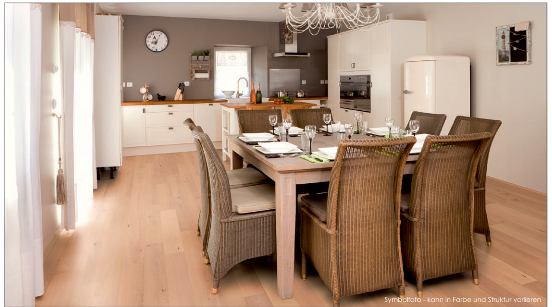
Symbolfoto - kann in Farbe und Struktur variieren